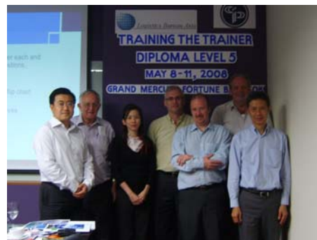
บรรยากาศการฝึกอบรมวิทยากร โดยทีมวิทยากรจากลอจิสติกส์ บูโร เอเชีย ได้รับการอบรมโดยตรงจากผู้เชี่ยวชาญของสถาบันจัดซื้อ (CIPS) จากประเทศสหราชอาณาจักร